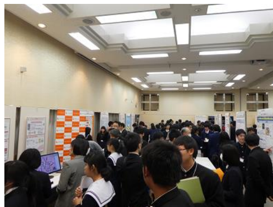
生徒によるポスター発表の様子 (科学三昧 in あいち 2017 会場：岡崎コンファレンスセンター)